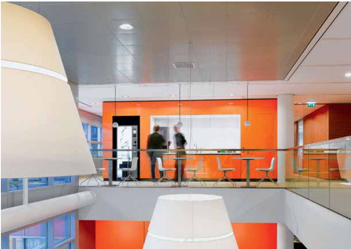
FOTO LINKSBOVEN Voor de accountmanagers zijn speciale akoestische 'bel-units' ontworpen