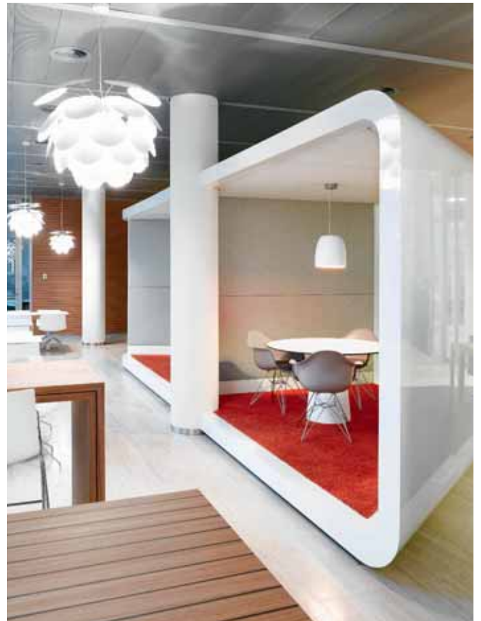
FOTO LINKS De entreehal, met receptiebar en trap naar de eerste verdieping

Interieurontwerp Heyligers d+p , Amsterdam Vloerafwerking / zonwering De Kruijff , Amsterdam Wanden / trap BEMA interieurbouw , Nieuw Vennepe Verlichting Arpalight , Bavel; Illum , Leimuiden Meubelmaatwerk Smeulders Interieurgroep BV Nuenen Foam elementen Klomp , Muiden Standaard meubilair SV Interieurgroep , Rotterdam; Lensvelt , Breda; Steelcase , Amsterdam Projectmanagement G&S Vastgoed , Amsterdam Aannemer G&S bouw , Amsterdam Installaties Bosman bedrijven , Amersfoort Makelaar Van Gool Elburg , Amsterdam Vloeroppervlak 4500 m 2