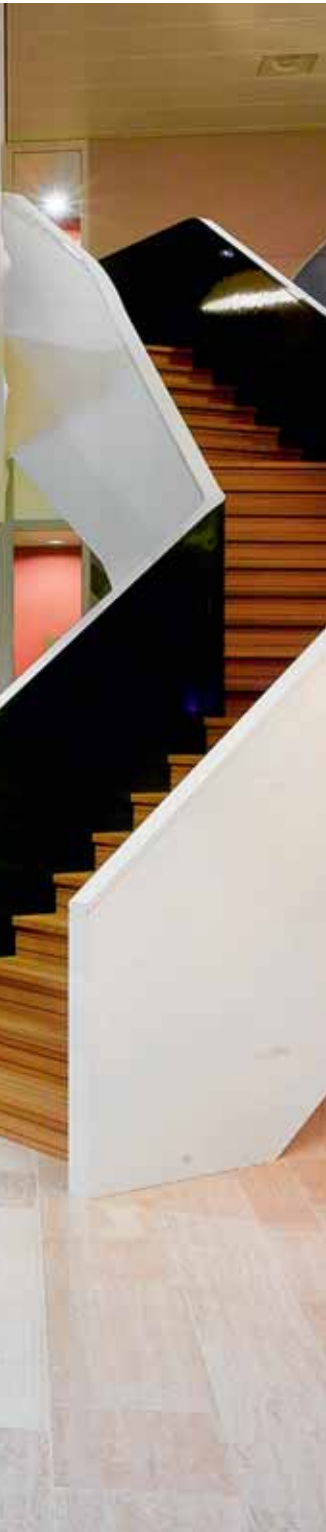
FOTO RECHTS Intake-ruimte op de begane grond, naast het restaurant